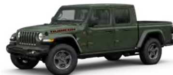
8. サージグリーン C/C