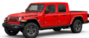
2. ファイヤークラッカーレッド C/C