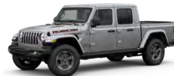
9. シルバージェンス C/C