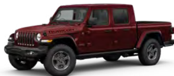
6. スナッツベリー P/C