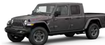
4. グラナイトクリスタルメタリック C/C