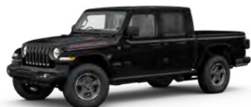
1. ブラック C/C