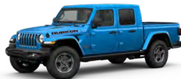
7. ハイドロブルー P/C