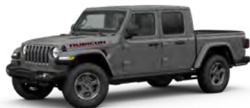
5. スティンググレー C/C