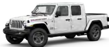
3. ブライトホワイト C/C