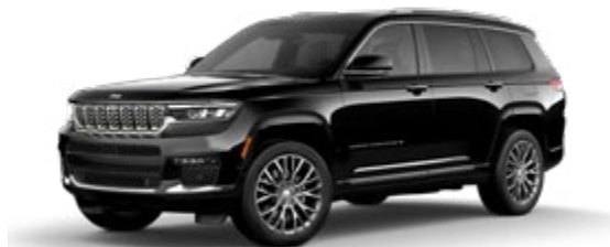
1. ダイヤモンドブラッククリスタル P/C