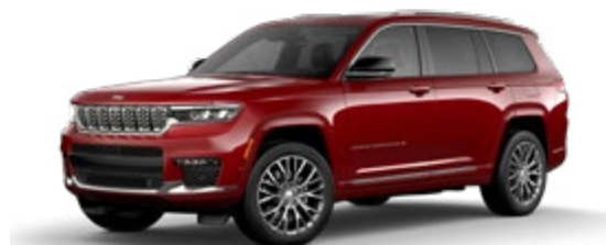
4. ヴェルヴェットレッド P/C