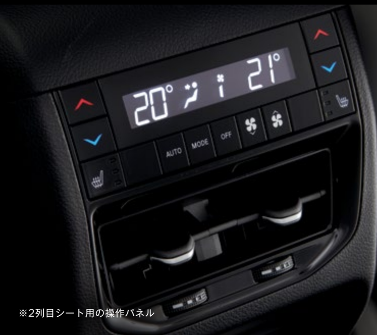
※2列目シート用の操作パネル