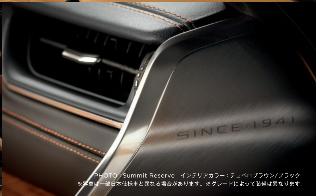
PHOTO: Summit Reserve インテリアカラー: テュベロブラウン/ブラック ※写真は一部日本仕様車と異なる場合があります。 ※グレードによって装備は異なります。