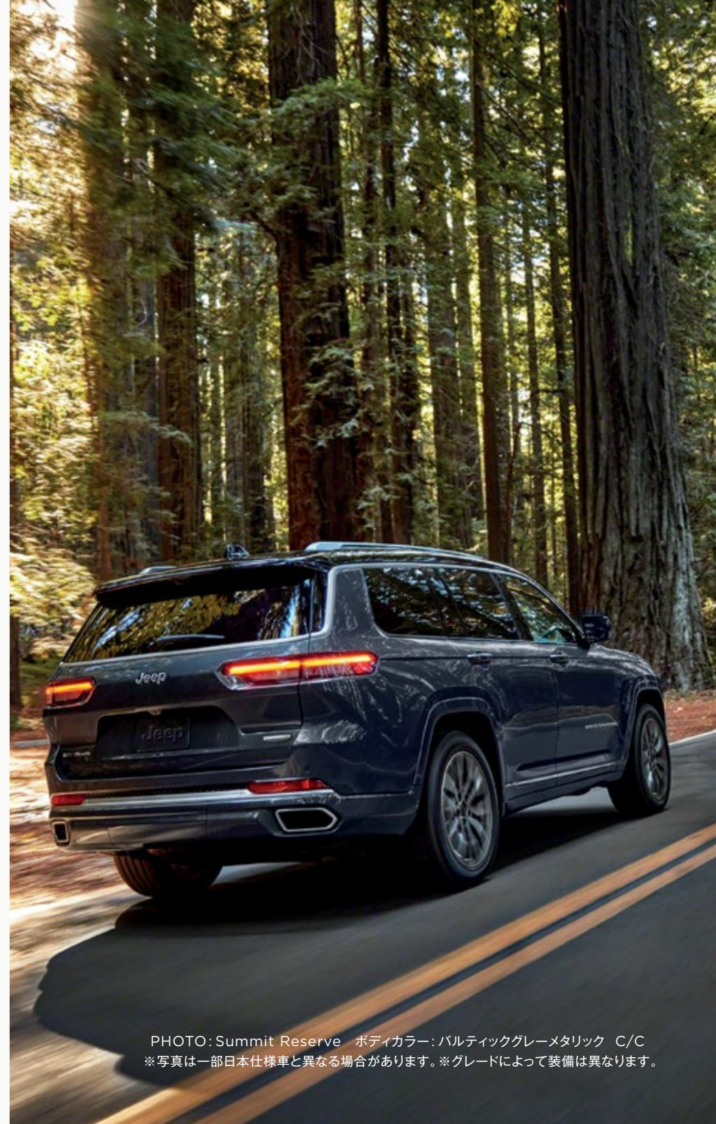
PHOTO: Summit Reserve ボディカラー: バルティックグレーメタリック C/C ※写真は一部日本仕様車と異なる場合があります。※グレードによって装備は異なります。

*4:衝突被害軽減ブレーキの作動には一定の条件があります。また道路状況、車両状態、天候状態およびドライバーの操作状態等によっては作動しない場合があります。ドライバーは本機能を過信せず、細心の注意をはらって運転操作を行ってください。*5:車線変更前には必ず周りの車両を目視で確認してください。*6:ParkSense®縦列 / 並列パークアシスト・アンパークアシストは駐車時の補助機能です。駐車場のスペースや状況により作動しない場合もございます。車両の操作をするときは周囲の安全を目視やミラーで直接確認し、適切な運転操作を行ってください。*7:インターセクションコリジョンアシストは交差点右折時の対向車の動向を監視するシステムで、車両の動作を制御し衝突を回避するための措置を講じる機能ではありません。