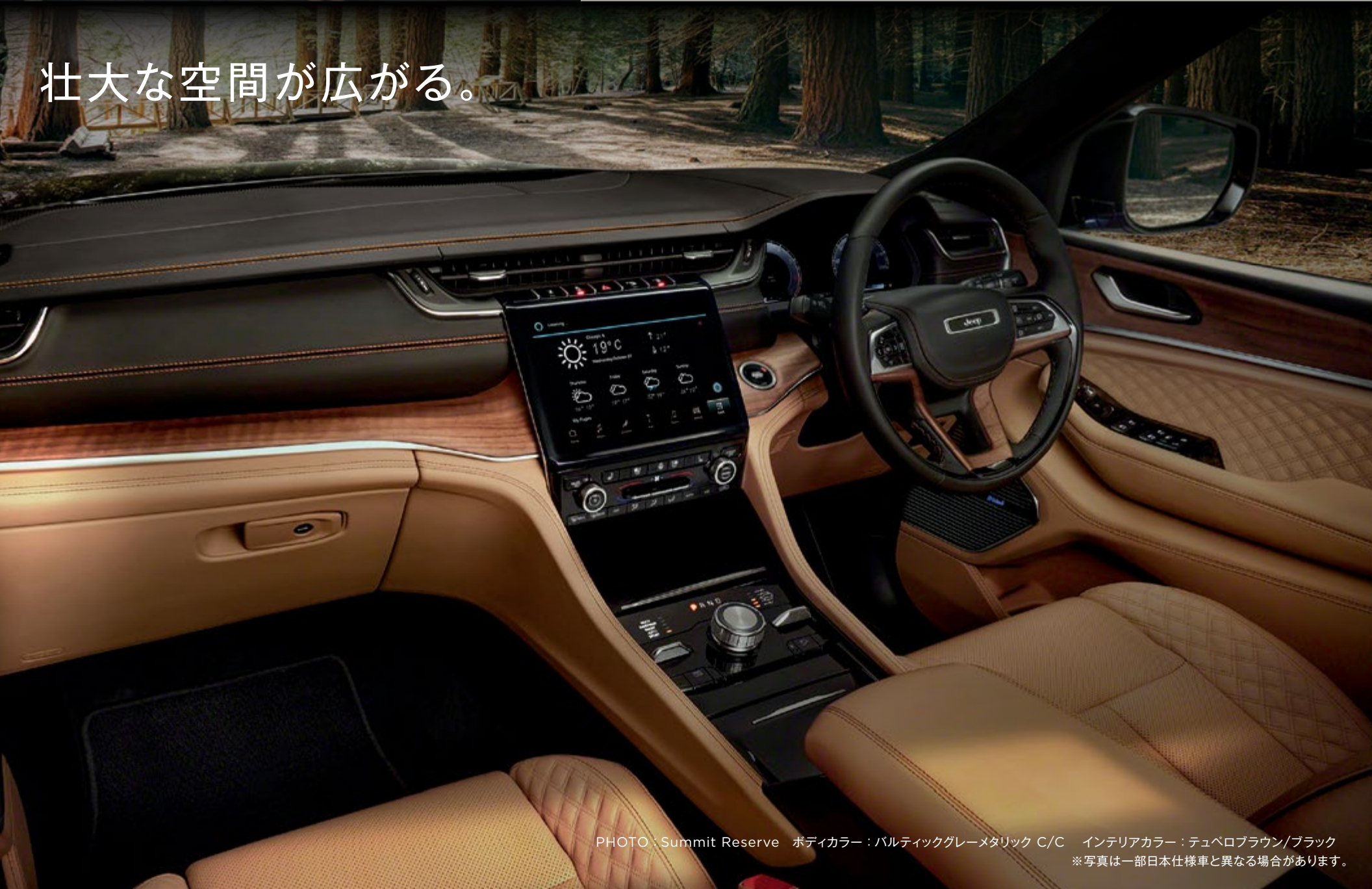
PHOTO : Summit Reserve ボディカラー : パルティックグレーメタリック C/C インテリアカラー : テュベロブラウン/ブラック ※写真は一部日本仕様車と異なる場合があります。