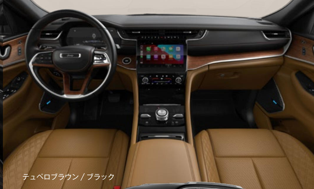
テペロブラウン / ブラック