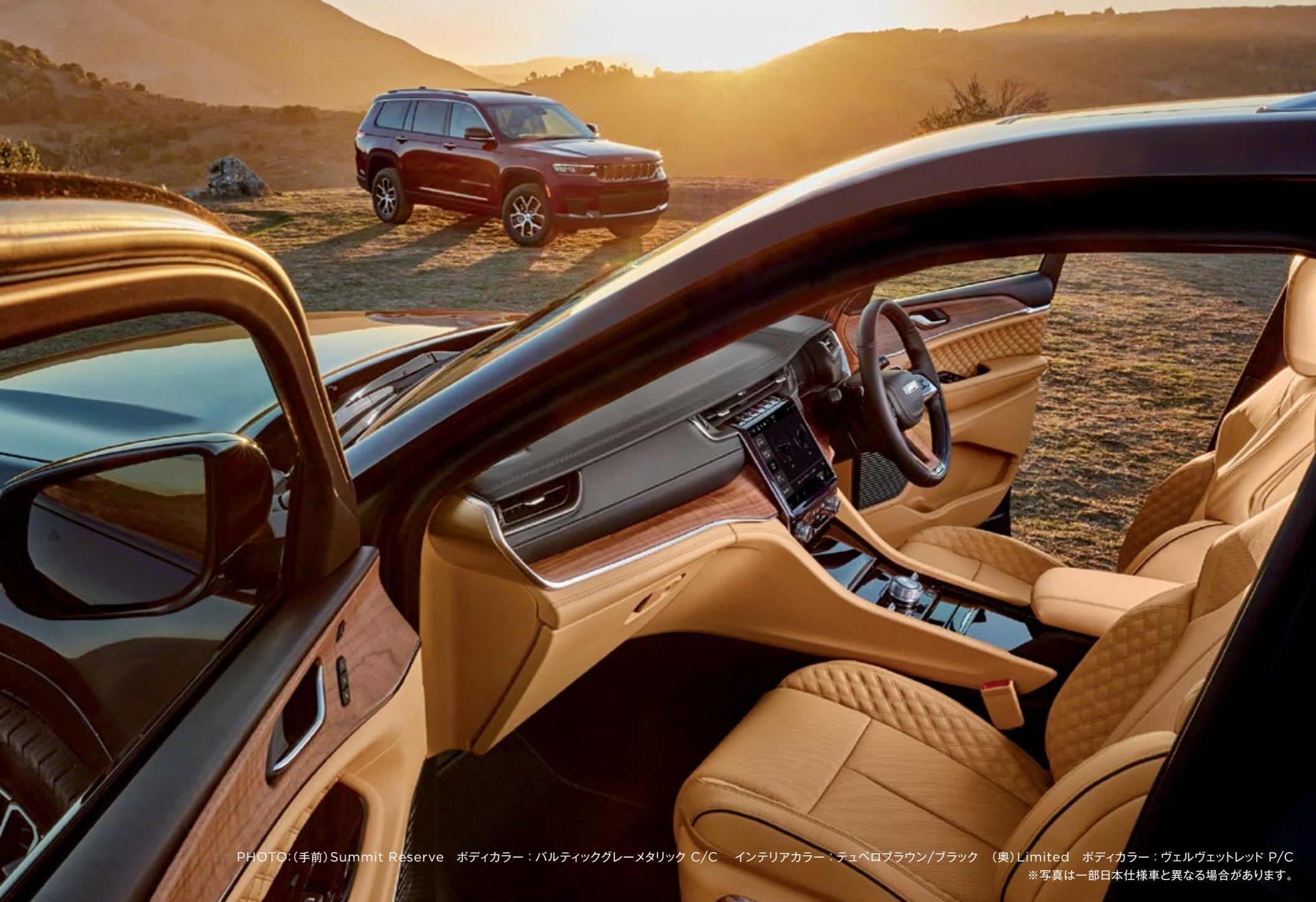
PHOTO:(手前) Summit Reserve ボディカラー：バルティックグレーメタリック C/C インテリアカラー：テュベロブラウン/ブラック (奥)Limited ボディカラー：ヴェルヴェットレッド P/C ※写真は一部日本仕様車と異なる場合があります。