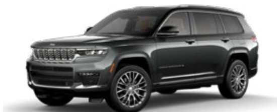
3. バルティックグレーメタリック C/C