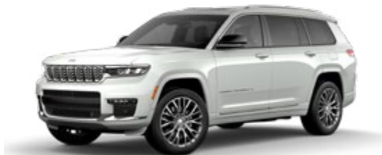
2. ブライトホワイト C/C