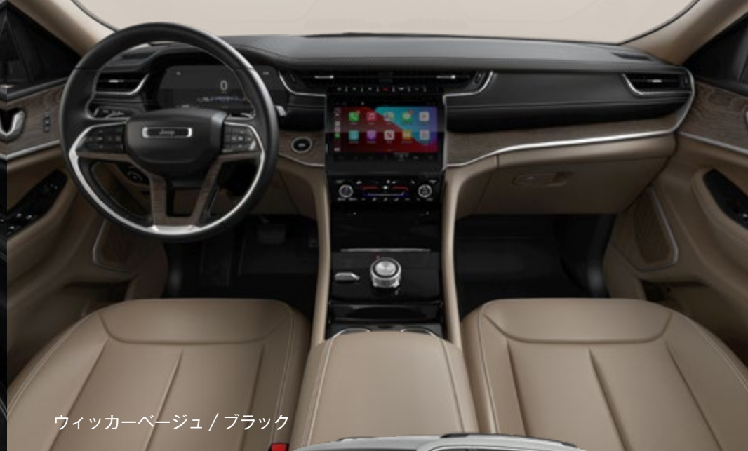
ウィッカーベージュ / ブラック