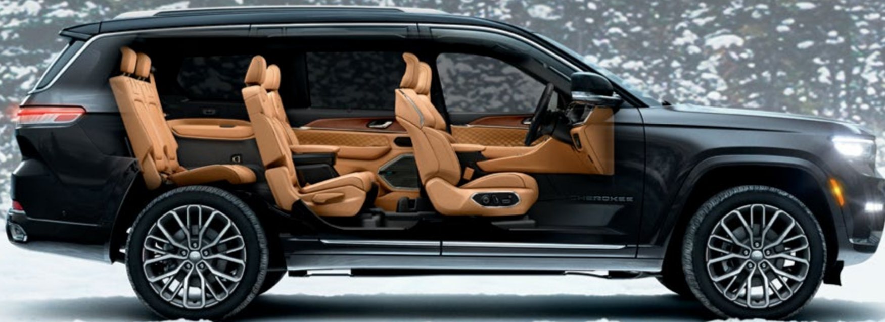
PHOTO : Summit Reserve ボディカラー : パルティックグレーメタリック C/C インテリアカラー : テュベロブラウン/ブラック ※写真は一部日本仕様車と異なる場合があります。

上質で艶やかなレザーやハイエンドな室内装備、近未来テクノロジーが息づく 広大な居住空間と次世代の安全性能が、オフローダーの概念を一変させる、 どこまでも静かで豊かな時間をもたらします。