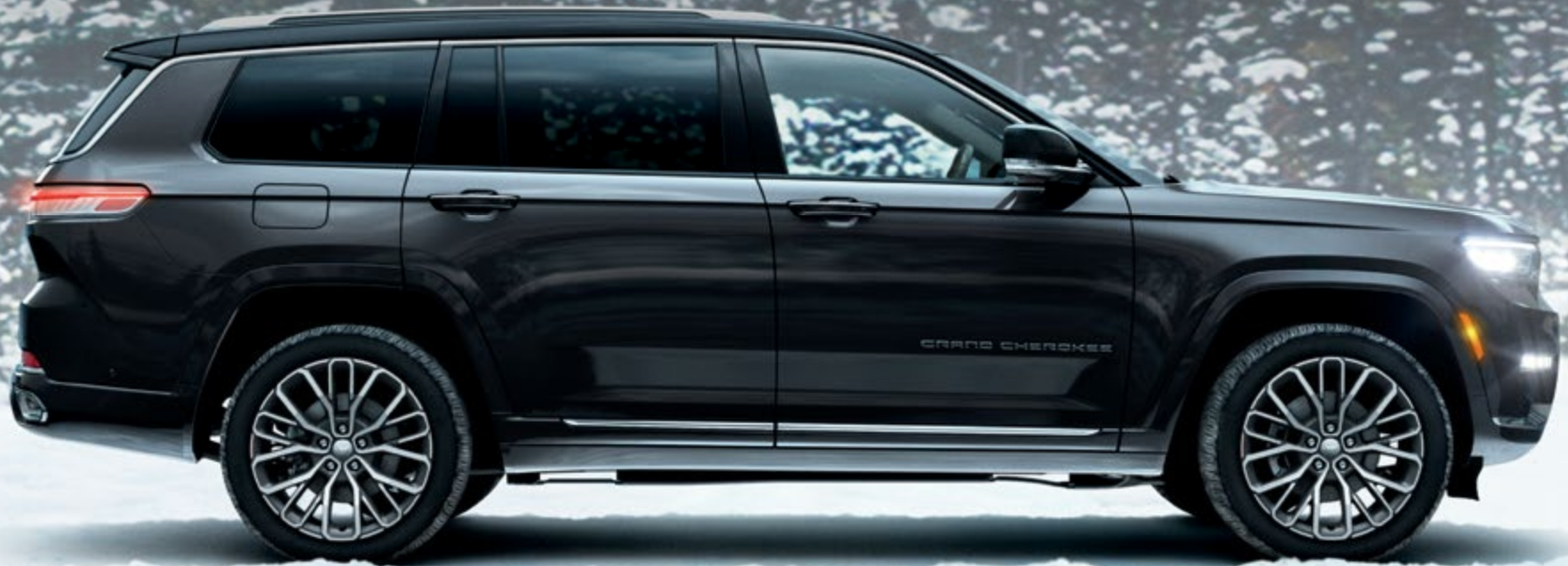
PHOTO : Summit Reserve ボディカラー : パルティックグレーメタリック C/C ※写真は一部日本仕様車と異なる場合があります。

ラグジュアリーSUVの先駆けWagoneerのDNAを受け継ぐ伝統のスタイリング。 力強さと美しさが融合するダイナミックなフォルムは、フラッグシップを語るにふさわしい 圧倒的な存在感を放ちます。