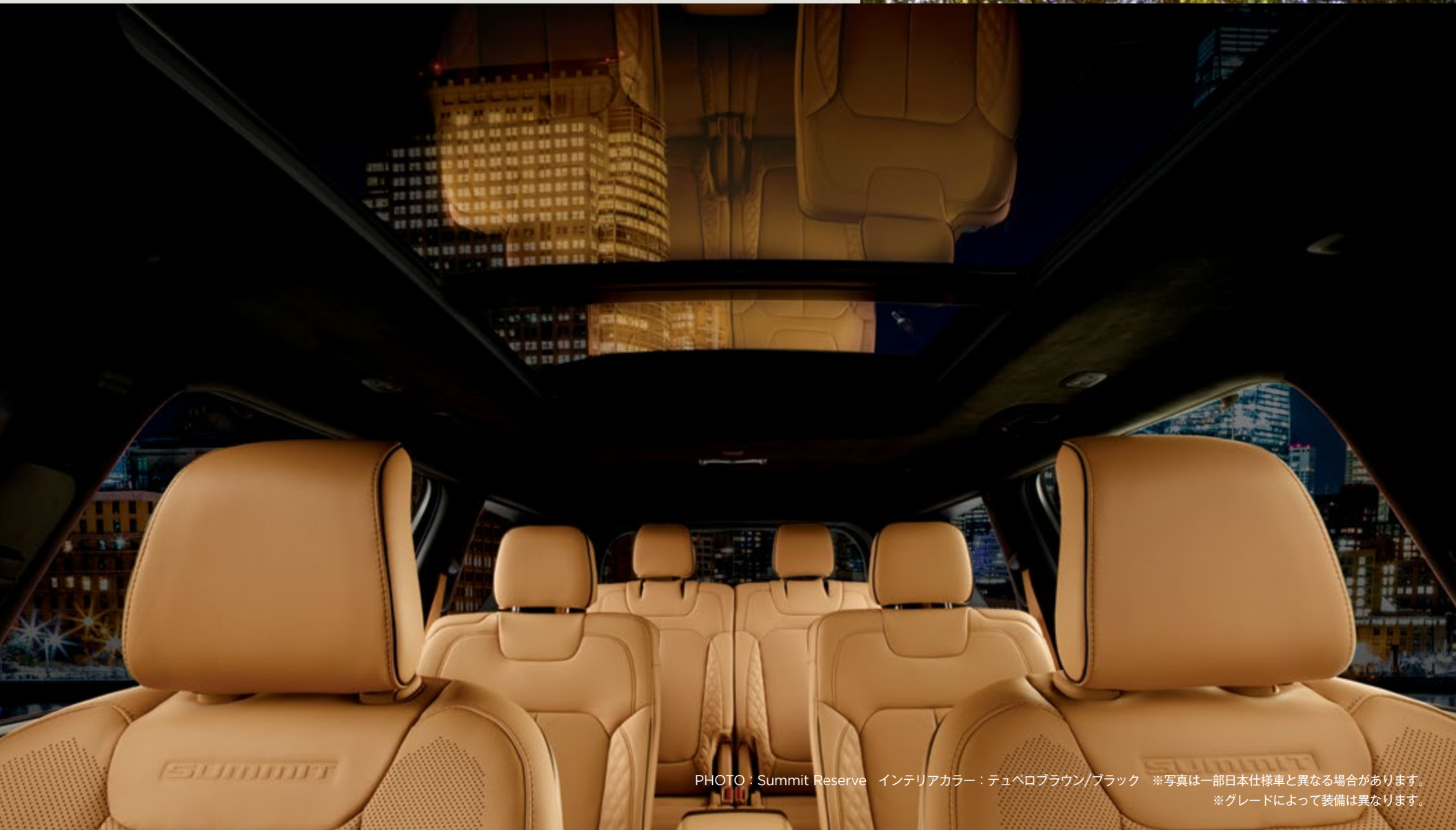
PHOTO : Summit Reserve インテリアカラー : テュベロブラウン/ブラック ※写真は一部日本仕様車と異なる場合があります。 ※グレードによって装備は異なります。