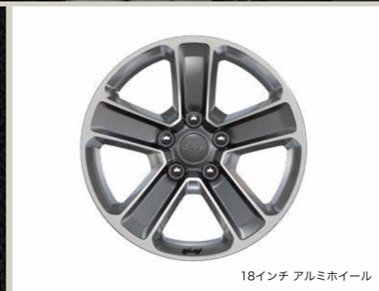
18インチ アルミホイール