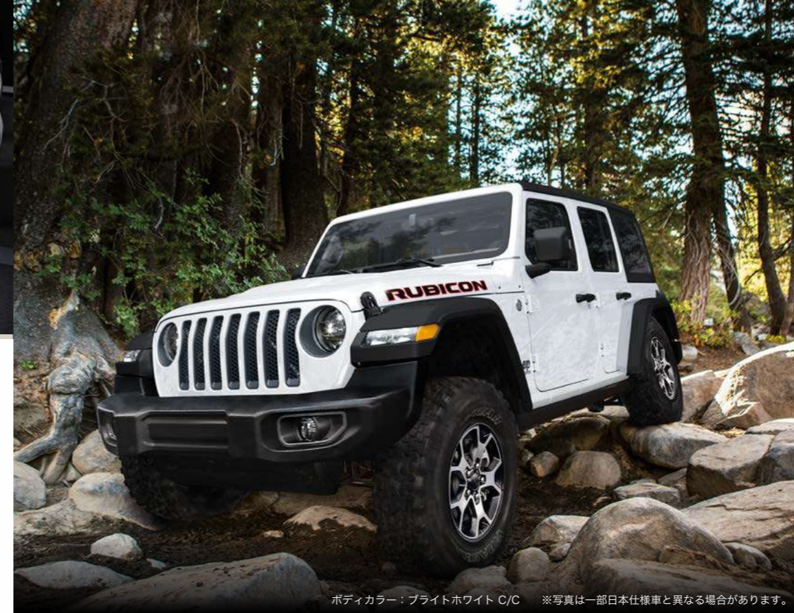
ボディカラー：ブライトホワイト C/C ※写真は一部日本仕様車と異なる場合があります。