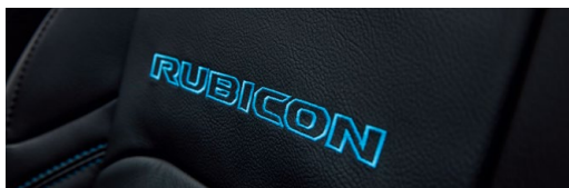
レザーシート(フロント:Rubicon刺繍入り)