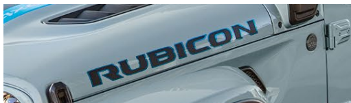
Rubicon デカール(Wrangler 4xe専用)