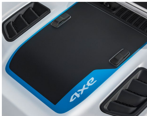
4xe ブラックフードデカール