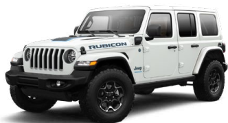
ブライトホワイト C/C