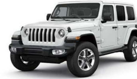
2 ブライトホワイト C/C