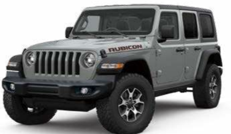
4 スティンググレー C/C