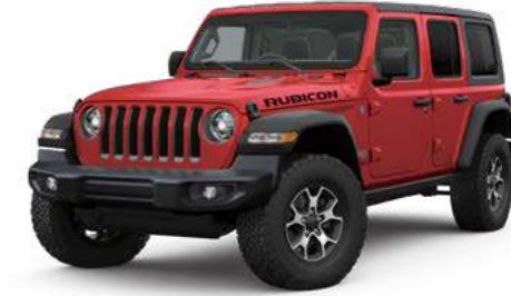
3 ファイヤークラッカーレッド C/C