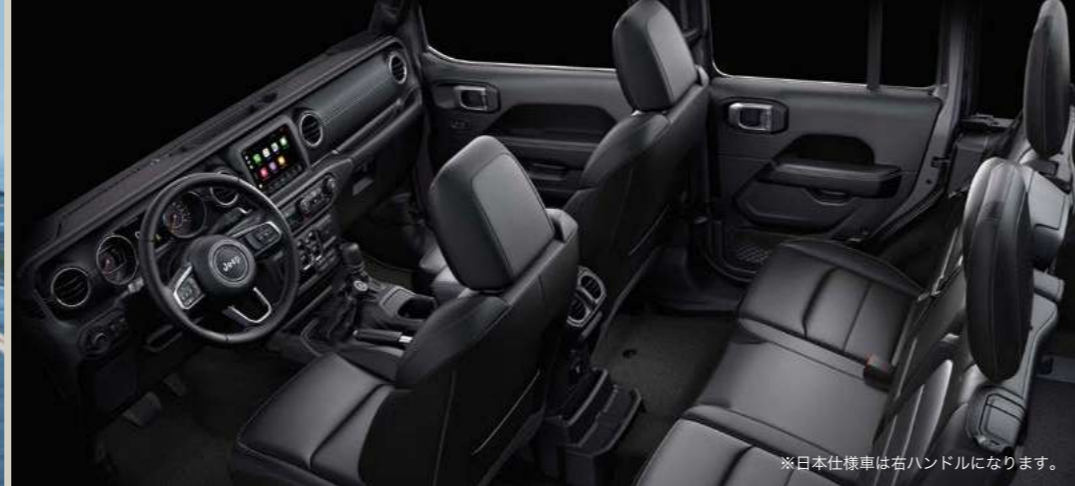
※日本仕様車は右ハンドルになります。