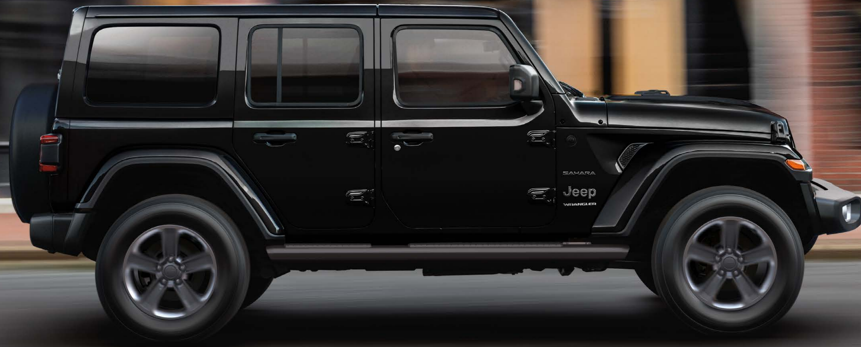
PHOTO : Unlimited Sahara ボディカラー : ブラック C/C ※写真は一部日本仕様車と異なる場合があります。