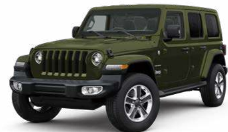
5 サージグリーン C/C