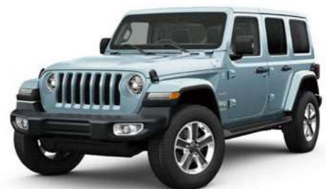
6 アール C/C