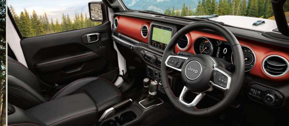
ブラック（レザーシート）