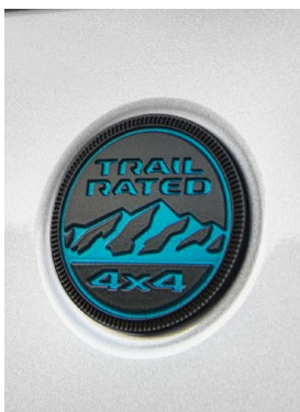
TRAIL RATEDバッジ (4xe専用)