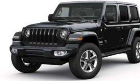
1 ブラック C/C