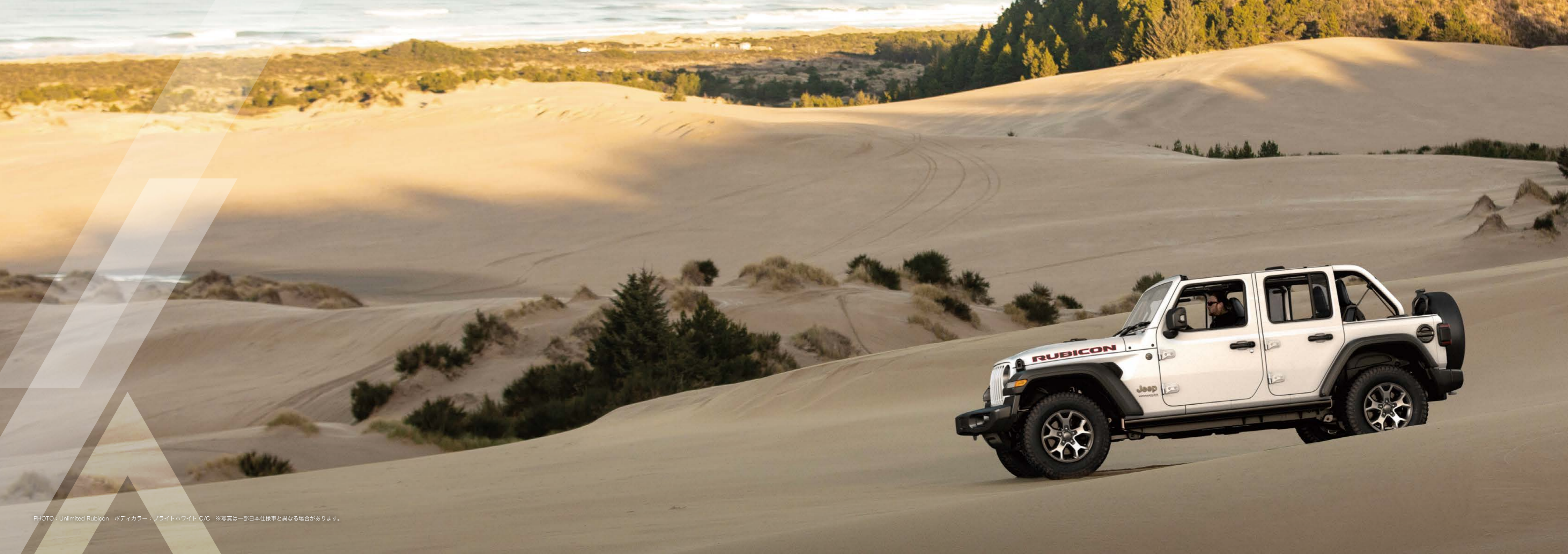
PHOTO : Unlimited Rubicon ボディカラー : プライトホワイト C/C ※写真は一部日本仕様車と異なる場合があります。