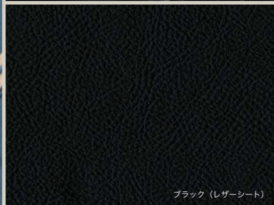
ブラック（レザーシート）