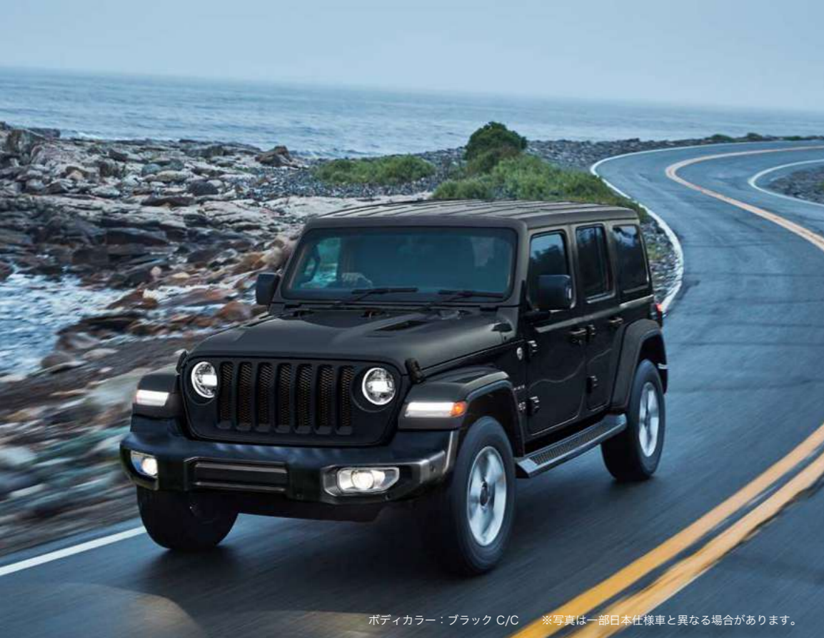
ボディカラー：ブラック C/C ※写真は一部日本仕様車と異なる場合があります。