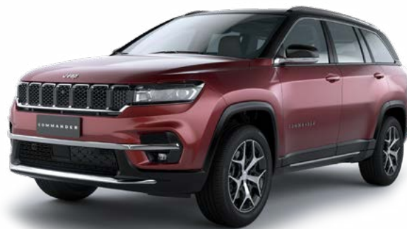
2. ヴェルヴェットレッド P/C