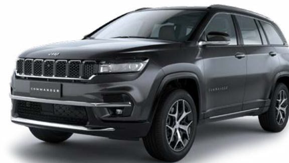
4. グレーマグネシオ メタリック C/C