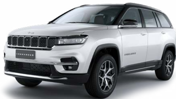
1. パールホワイトトライコート