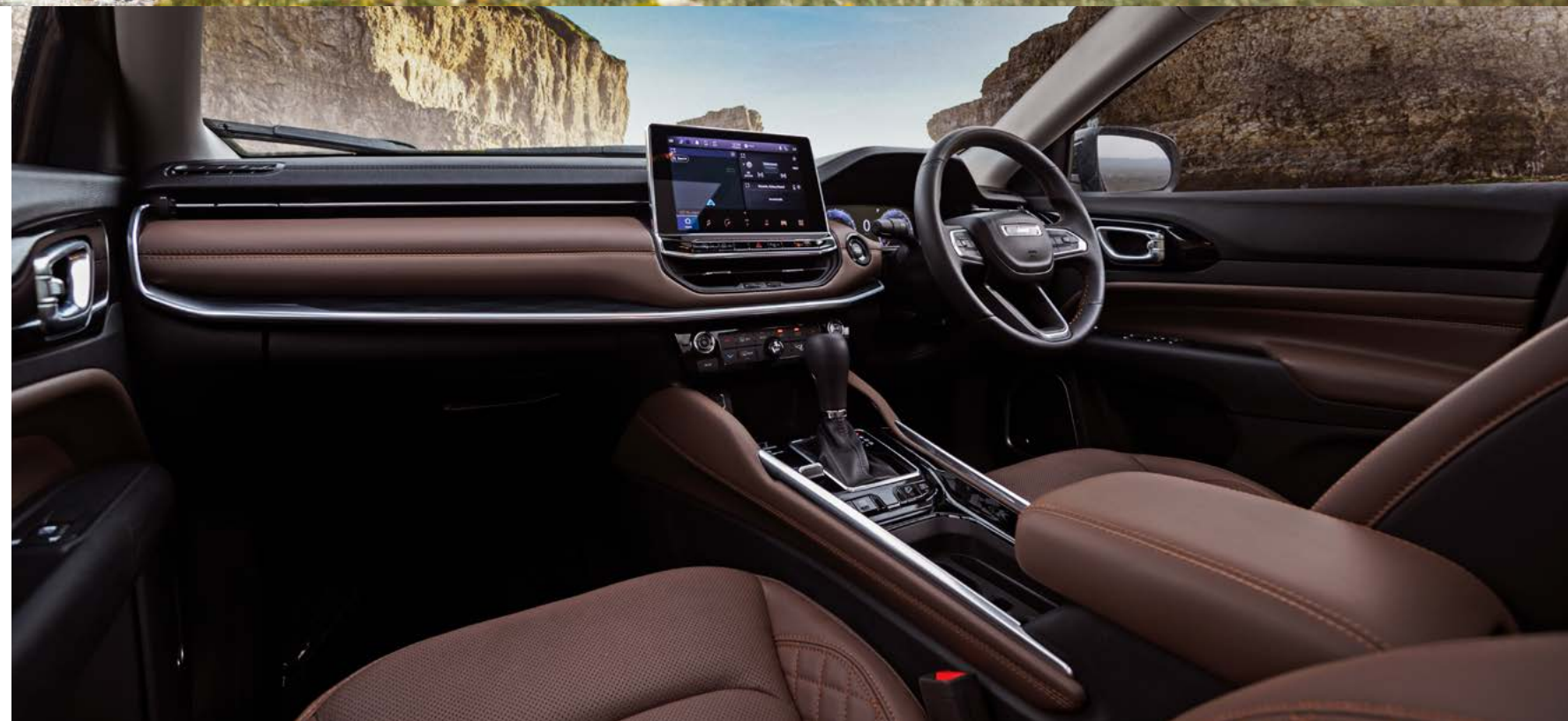
PHOTO: Limited ボディカラー: ヴェルヴェットレッド P/C インテリアカラー: エンペラードールブラウン/ブラック ※写真は一部日本仕様車と異なる場合があります。

上質なデザインと優れた実用性、3列目まで乗る人すべてにゆとりの空間。軽快な2.0ℓディーゼルエンジンとパワフルなオフロード走行性能が、にぎやかでアクティブな毎日を実現するミッドサイズSUV。