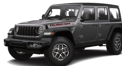
4 グラナイトクリスタルメタリック C/C