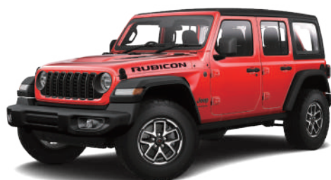
3 ファイヤークラッカーレッド C/C