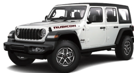
2 ブライトホワイト C/C