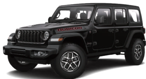
1 ブラック C/C